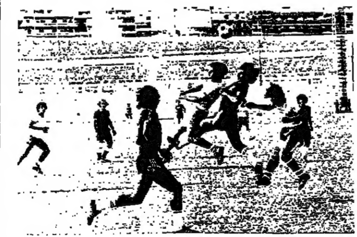
لقطة من المباراة

في اول مباريات بطولة لبنان بكرة القدم الموجهة فاز فريق «الانصار» على «الصفاء» ٢-١ بعد ان اسفر الشوط الاول عن اصابتة واحدة سجلها محمد المنطق في الدقيقة ٢٧ ، ثم اصيب حارس مرمى